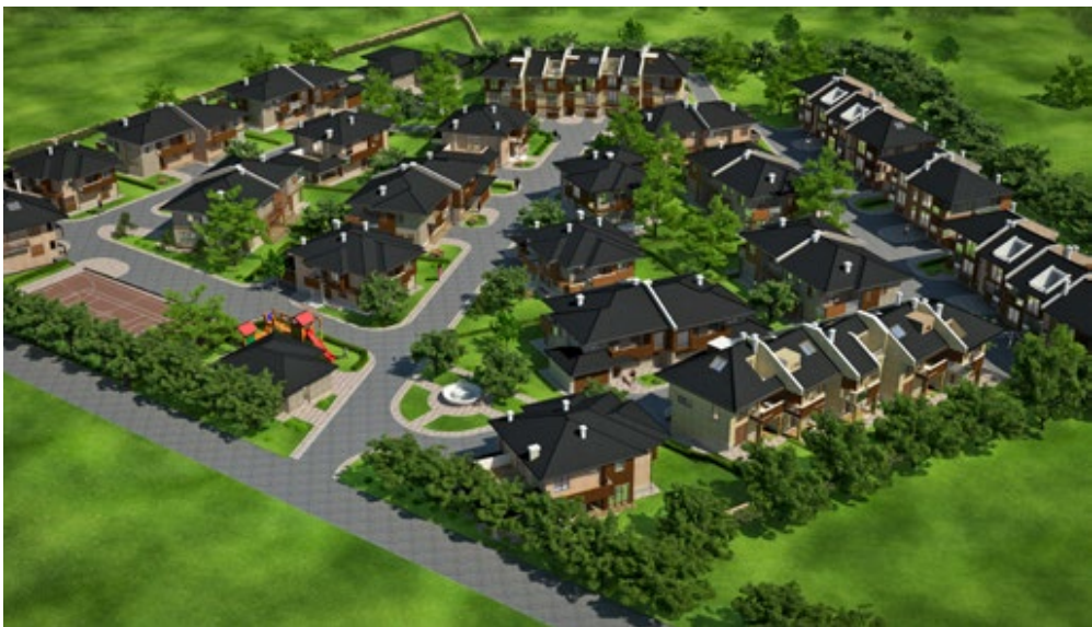
Проект: "Плана хайтс" ще бъде най-модерното зелено селище в България

– Получихме подкрепата на община Самоков още от първия ден. Те искаха точно колкото нас