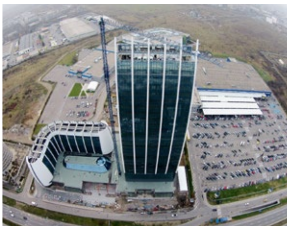
Приоритет: Най-голям интерес за израелските инвеститорите представлява търговията с недвижими имоти и строителството

Развитието на българо-израелските отношения в тази област започва от 1996 г., защото именно тогава бе подписан и ратифициран Договорът за насърчване и взаимна защита на инвестициите. Най-атрактивни за израелските инвеститори по данни на икономическото ни министерство са следните сектори: операции с недвижимо имущество, наемодателна дейност и бизнес услуги, търговия,